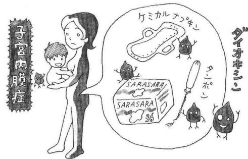
「ひろがれひろがれ エコ・ナプキン」 (地湧社 発行 角張光子 著)より転載

市販の使い捨てナプキンは、ほとんどが石油系の素材で、表面には漂白したレーヨンやポリエステル、ポリプレンなどの不織布、内部にも漂白した綿状パルプや高分子吸収剤、ポリマー等の吸収促進剤、消臭のためのデオドラント剤、香料などが使われています。